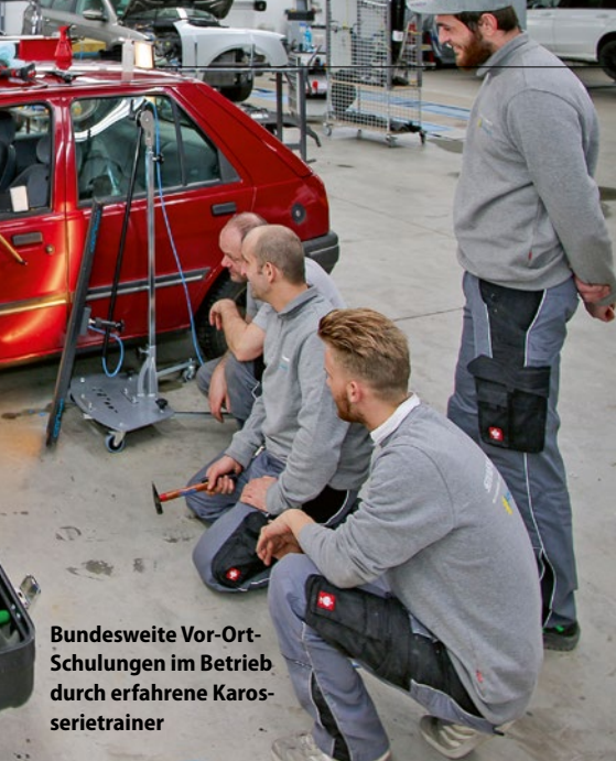
Bundesweite Vor-Ort-Schulungen im Betrieb durch erfahrene Karosserietrainer