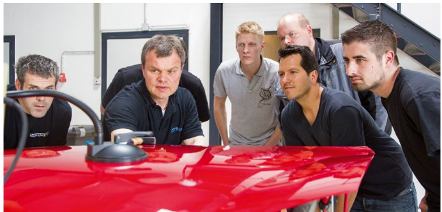
Mit AOL-Klebeteknik, Know-how und viel Übung schneller zum Ziel

Reparaturmethode jedoch noch weitaus intensiver nutzen.“ Schließlich, erklärt Müller, kommen angelieferte Neuteile öfter als nicht mit Transportschäden ins Haus, manche würden dann versehentlich noch im eigenen Lager beschädigt.