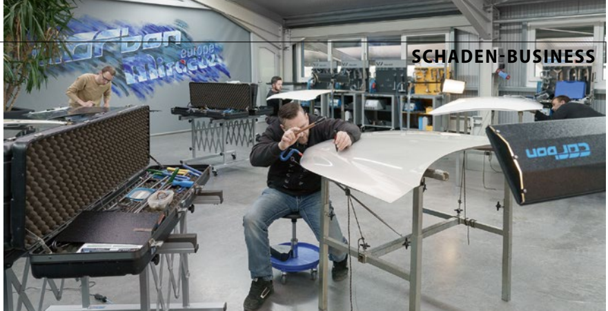
Effektive AOL-Schulung in Kleingruppen von maximal acht Teilnehmern im Carbon-Schulungszentrum

betechnik unverzichtbar geworden und wird bei Carbon auch entsprechend konsequent geschult.